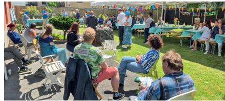
Fête des 20 ans

61 activités en coanimation ont totalisé 181 heures bénévoles de la part des pairs.