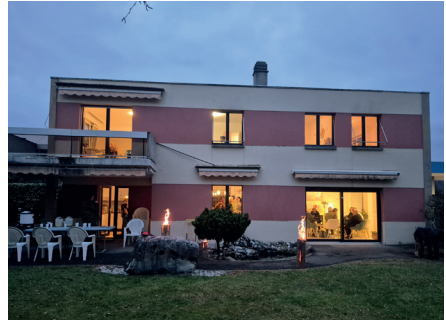
Portes ouvertes dans notre lieu d'accueil à Monthey

À cela s'ajoutent 5 interventions auprès de partenaires socio-sanitaires et de (futur-e-s) professionnel-le-s – notamment au CCPP de Martigny et de Sierre, auprès d'étudiant-e-s en travail social à la HES, ainsi que lors de deux interventions à Malévoz, touchant 103 personnes engagées ou en formation dans le secteur.