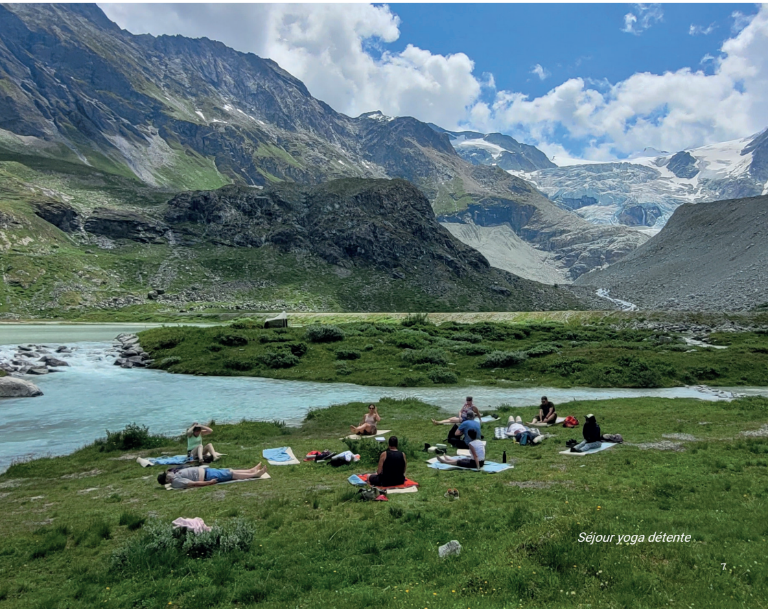
Séjour yoga détente

Ces activités — ateliers d'écriture, initiation à la méditation et au yoga, repas-partage, atelier vitrail — sont proposées tout au long de l'année et connaissent un succès croissant, tant par le nombre de cours offerts ( +38% ) que par le nombre de participants, en hausse de près de 22% .