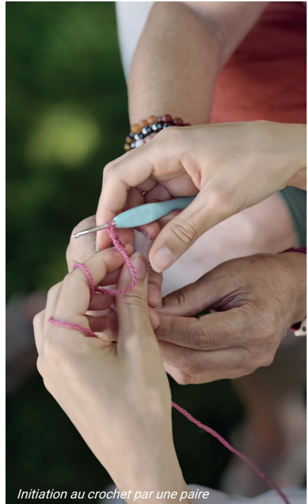
Initiation au crochet par une paire

Fréquentation 2025 = 205 (+11%) participants