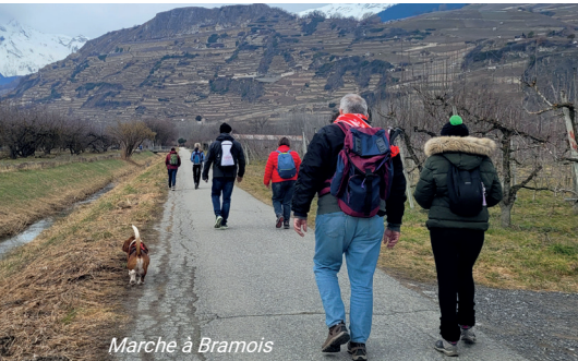
Marche à Bramois

Le programme d'activités de l'Avep, élaboré trois fois par an par les membres de l'Avep et l'équipe professionnelle, offre une multitude de moments de rencontre, partage et loisirs pour les personnes confrontées à des difficultés psychiques et pour les proches. Au travers des cafés-rencontres, balades, ateliers, repas-partage, séjours, etc. des liens se créent, l'entraide apparaît, la solitude s'éloigne.