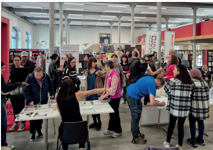
Bibliothèque vivante à la médiathèque à Sion

la Journée mondiale de la santé mentale, notre participation au marché de Noël de Sion, ainsi que les portes ouvertes de notre lieu d'accueil à Monthey. L'ensemble de ces actions de terrain a permis de sensibiliser pas moins de 514 personnes.